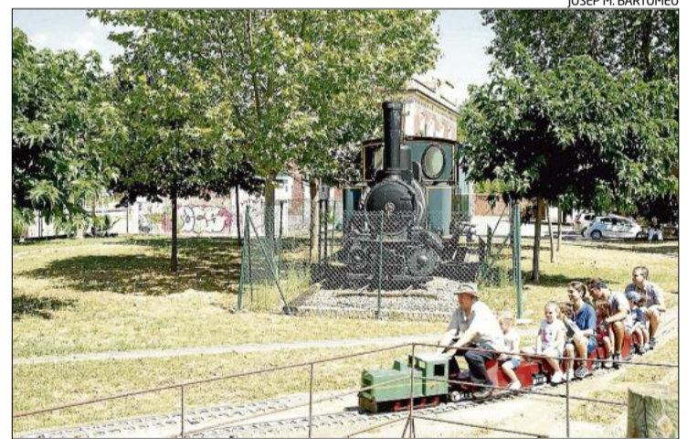
Alguns dels nens que van pujar al trenet, donant voltes pel circuit.

La trobada va ser un èxit d'assistència de públic, sobretot a la tarda.